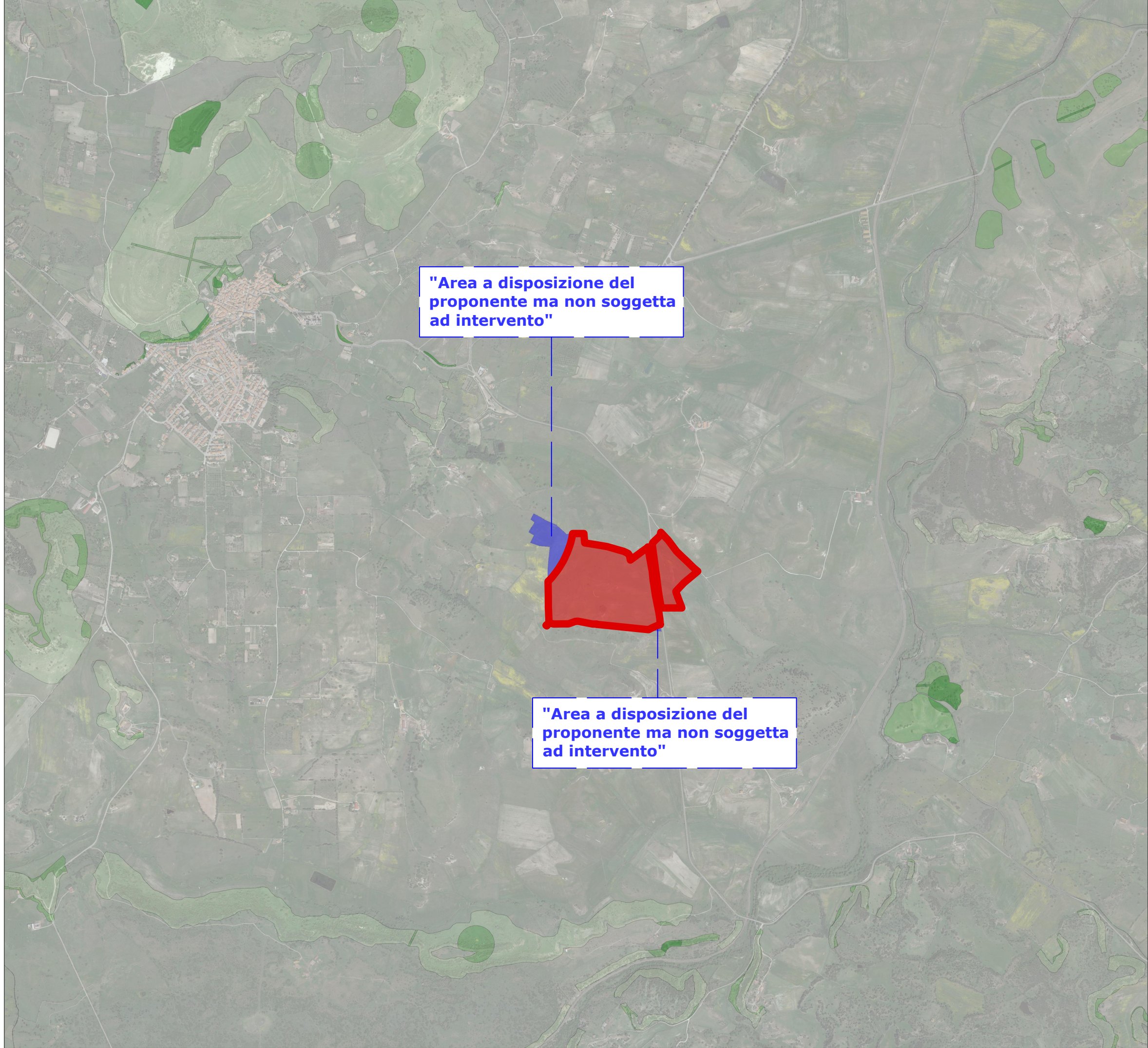
3_Inquadramento su Carte PAI / Rischio Geomorfologico / 1:20.000